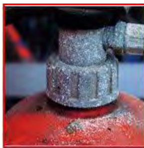
キャップや底部の錆び

・消火器の安全ピンのところに、封印シール又は封印の部品が付いているか（切れていないか）確認してみましょう。封印が切れているものは使用後の消火器の可能性がります。